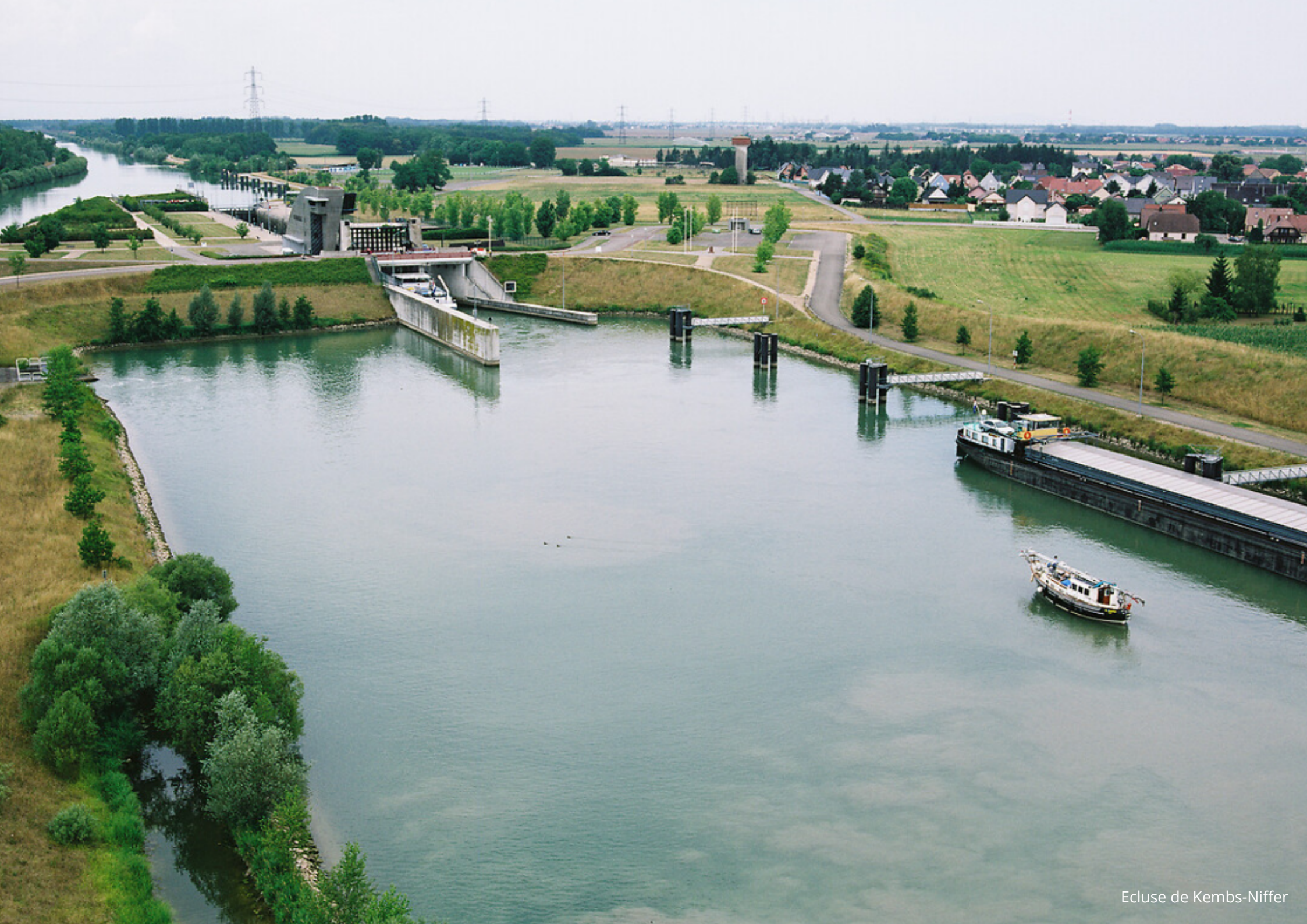
Ecluse de Kembs-Niffer