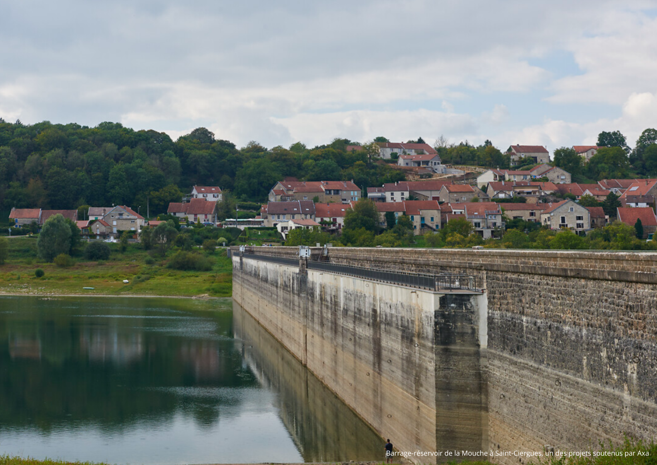
Barrage-réservoir de la Mouche à Saint-Ciergues, un des projets soutenus par Axa